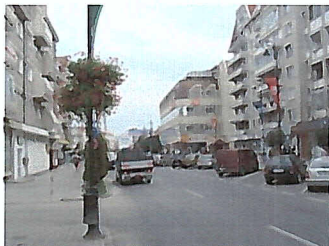
Vedere bloc de locuinte